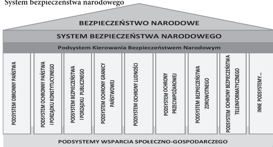
Rys. 1. System bezpieczeństwa narodowego

Źródło: opracowanie własne na podstawie: G. Sobolewski, Zarządzanie kryzysowe w systemie bezpieczeństwa narodowego. W: G. Sobolewski, D. Majchrzak (red.), Wybrane zagadnienia zarządzania kryzysowego, s. 17–19